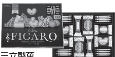
三立製菓 サンフィガロ クッキーパイ6種(38袋入り) T-3