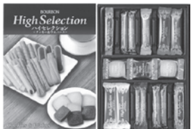
ブルボン ハイセレクション(33袋) T-8