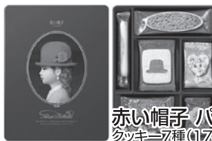
赤い帽子 パール クッキー37種(117枚入り) T-5